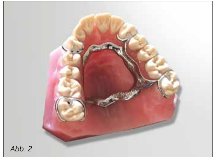
Abb. 2: Modellgussprothese

Die Ästhetik der [ZM:FlexProthese] überzeugt sofort : Kosmetisch störende Metallklammern oder Transversalverbinder aus Metall entfallen. Durch die Transluzenz der [ZM:FlexProthese] wird die natürliche Zahnfleischfarbe aufgenommen und fügt sich fast unsichtbar in das Restgebiss ein.