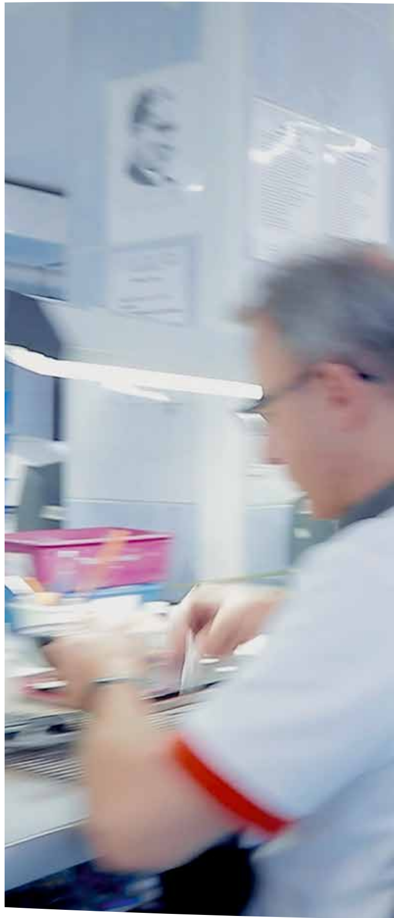
Ein Blick in die Keramikabteilung unseres Partnerlabors.

Seit mehr als 25 Jahren bieten wir auch Zahnersatz aus dem Ausland an. Zahnärzte und Patienten profitieren hierdurch nicht nur von großen finanziellen Ersparnissen, sondern zunehmend auch von einem Technologievorsprung.