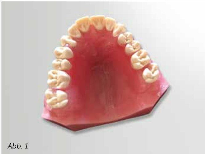
Abb. 1: [ZM:FlexProthese]

Ersatzzähne auf: 14 | 15 | 16 | 24 | 25 | 26 Klammern auf: 13 | 17 | 23 | 27