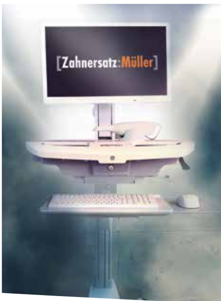
DiOS® 4.0 Intraoralscanner