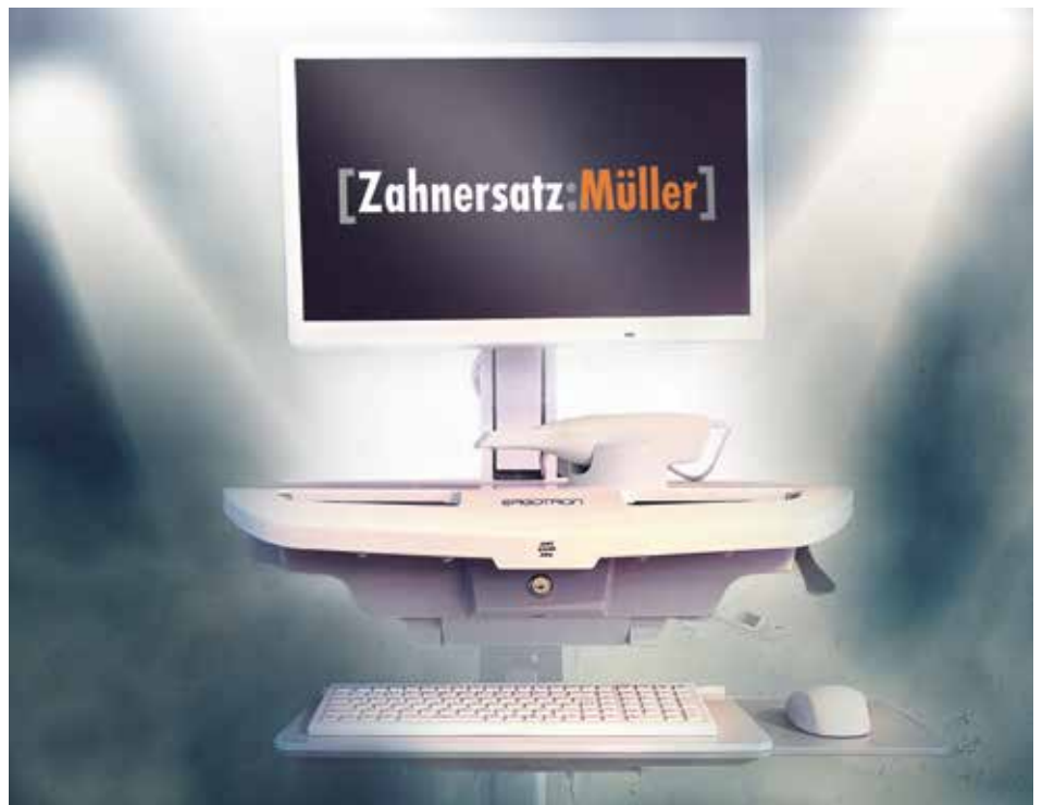
DiOS® 4.0 Intraoralscanner